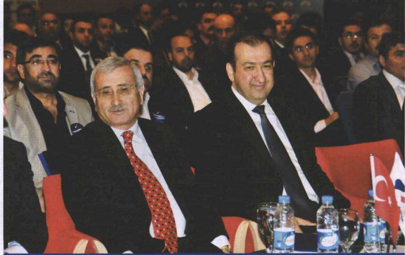
Merkez Bankası eski başkanı Durmuş Yılmaz, Çobanyıldızı Buluşmaları'nın onur konuğu oldu.

Konya ile ilgili rakamlara gelince, yine Çelik'in verdiği bilgiye göre, 2010 yılında Konya 9 milyar TL kredi kullandı. Banka Asya bunun 300 milyon TL'sini sağladı ve